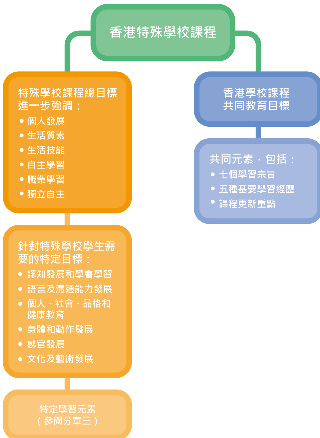
圖 2.2 香港特殊學校課程